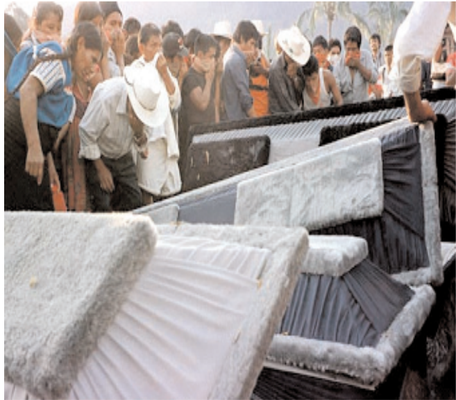
Muerte fuera de campo. Oriana Eliçabe. El 10 de junio de 1998 se produjo la detención de 7 jóvenes en el poblado Unión Progreso de los Altos de Chiapas. Tres días después, el ejército devolvió los cadáveres casi irreconocibles. Esta fotografía es una elipsis del horror y un homenaje a la experiencia continua del presente llevada a cabo por el pueblo de Chiapas.

Esto explicitó su trato personal con la realidad y estableció un respeto por los personajes de sus fotografías. En sus trabajos, casi todos los personajes aparecen en primer plano ataviados con el paliacate 9 , y muchos otros se confunden con el fuera de campo de la fotografía, casi en los límites de su encuadre, confundidos con