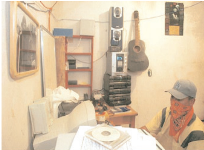
Emisora de radio. Chiapas.

Foucault: «En conjunto, [su obra] es una caja de herramientas ». La recuperación de la memoria, el acceso libre a la información, la liberación de visibilidades para su puesta en común en la sociedad y su almacenamiento para la reutilización condensan el último elemento que vamos a aplicar de Rancière al trabajo de Orianómada, en cuanto deslizamiento del arte contemporáneo: la convivencia de materiales heterogéneos que no produce conflicto, el inventario que pretende «repoblar el mundo de las cosas, rescatar su potencial de historia común». En nuestro caso, «el artista es a la vez el archivero de la vida colectiva y el coleccionista, testigo de una capacidad compartida». Pues bien, todos los materiales y las sucesivas apropiaciones del arte activista constituyen una base documental para sucesivos eventos, y su continuidad se mantiene más allá de la experiencia de «la vida como obra de arte».