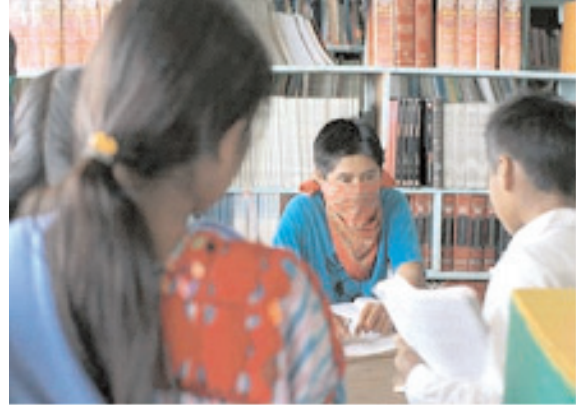
Orianómada, Joven atendiendo la Biblioteca de Oventik, Altos de Chiapas

El concepto fuerte y de conjunto en toda la producción activista es de nuevo la necesidad de autonomía documental, de autorrepresentación. La necesidad de una fotografía más de guerrilla semiótica, y menos de representación, contra el fotoperiodismo oficial y los nuevos sistemas comunicativos, con los que compartirá inevitablemente el espacio de los acontecimientos sociales y políticos, tanto como las hemerotecas, los hipertextos o las bibliotecas de la academia oficial. Esta guerrilla comunicacional sitúa en un lugar privilegiado el espacio del archivo, y es ajena desde luego al “mal de archivo”. Frente al uso recurrente de una cínica reinterpretación de la Historia por parte de las agencias de la comunicación, los medios, las prisiones del conocimiento institucional y académico, las grandes corporaciones de la cultura, e incluso de muchos museos e institutos de investigación, queda una gran tarea de revisibilidad, reinterpretación y reapropiación de los acontecimientos pasados y presentes: todo un tesoro documental de las historias invisibilizadas, necesitado de ser abierto a sus protagonistas. Para expresar la potencialidad última del arte activista podríamos utilizar el calificativo que Deleuze atribuía a la obra de