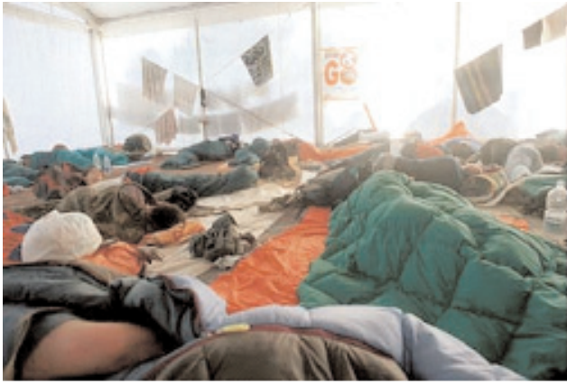
Descanso de los manifestantes antes de las manifestaciones contra el G8. Génova. Estadio Carlini

nada, sólo se convertirán en meros dinamizadores del proceso; por otra parte, si es un simple proceso explícito de convencimiento, terminará el ciclo con el convencimiento del receptor, y ahí morirá. Como práctica procesual, por el contrario, el activismo político ha de reaccionar contra un poder y una representación contemporáneos ya familiarizados con las tendencias procesuales, y cuyo actual instrumento de síntesis y organización es precisamente ése 20 . Si la obra o el proceso son abiertos y apuestan por un público que haga de base y de sostén, y no sólo de activador y de multiplicador, es muy posible que el arte activista respire y pueda reconducir la crítica a la invisibilidad y construir nuevas madejas de relaciones. Es posible que esa sea la razón por la cual los movimientos activistas apuestan por una intervención en el ritmo del orden visual, más que por un dominio del orden conceptual o racional: su efecto no es una representación simbólica sobre la cual discutir, sino una pugna semiótica que disloca los conceptos y abre sus manifestaciones; un fenómeno meteorológico o una catarsis cuyo efecto no es la discusión, sino una lucha de intermitencias.