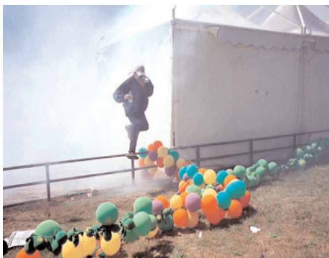
Manifestaciones de Génova. Orianómada

Ese hecho plantea un problema estético-político: el recurrente problema de la representación al que las propias vanguardias del siglo XX colaboraron con el oscurecimiento y la invisibilidad (metonímica o metafórica). Según Lyotard, la vanguardia se preocupó tanto por el «sucede» que terminó por devaluar el acontecimiento, el suceso mismo, en su intento de acceder a él 14 . De alguna manera, quiso anticiparse al tiempo y acabó suprimiendo su acontecer, su emergencia. Los vanguardistas sustituyeron el juego por su vaciamiento, y junto a la huida que proporcionaban la ilusión ficcional y el voyeurismo clásicos, fetichizaron la presencia y la envolvieron en algo completamente ajeno: la desmaterialización y la formalización. Para Lyotard es muy importante «hacer ver lo que hace ver, y no lo que es visible», pues el sentimiento subliminal no se queda anclado en el objeto, sino que está justo en el espacio donde pueden «suceder» los acontecimientos: «la metafísica del capital [es] una tecnología del tiempo [...]. La tarea vanguardista sigue siendo deshacer la presunción del espíritu con respecto al tiempo» 15 .