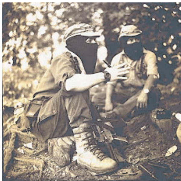
El subcomandante Marcos y el comandante Tacho en la selva Lacandona (1997). Ambos aparecen camuflados en la imagen. Su anonimato queda protegido y en ese compromiso les acompaña el color y la textura de la imagen: "Todos somos Marcos".

Era necesario trabajar al servicio del contenido visual de lo fotografiado, más que al servicio de la