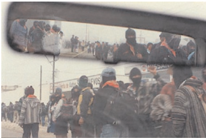
Caravana zapatista. Oriana Elicabe

Lejos de la objetividad y de la verdad, la presencia de lo representado en la fotografía es fantasmal, irónica, y su sentido es perceptible pero no acotable, es decir, que supera todo lo que deja ver. El segundo de los tipos de deslizamiento que nos sugiere Rancière nos conduce al punctum barthesiano y nos lleva fuera de la imagen, a