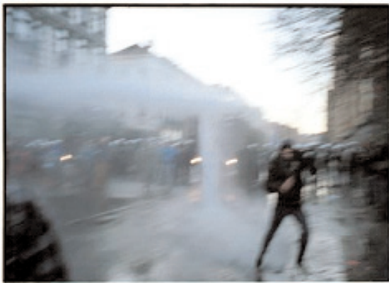
Manifestaciones antiglobalización en Bruselas. Oriana Eliçabe

El activismo, por tanto, tiene que ver con una acción deslocalizada e improvisada que busca aprovechar la ocasión; no podría quedarse sólo en una dinámica aislada en un lugar determinado, ya que es transfronteriza y su objetivo no es administrar relaciones, sino producirlas. De modo que incluso en las acciones de barrio de los grafiteros habría un afán de establecer vínculos con el otro lado de la visibilidad, ganar encuentros transfronterizos. Así, desde el fotoperiodismo, Oriánomada dio un giro hacia la fotografía activista, y desde la mediación de la técnica y la incorporación de ésta en la práctica de la transformación de la realidad social, dio un paso hacia una estética relacional comprometida: la fotografía debía proporcionar instrumentos de vinculación entre individuos, despegar las formas del fondo alienante en el que están socialmente inmersas, reintroducir lo múltiple y lo posible en el circuito cerrado de lo social 27 . «Cuando la vida de las